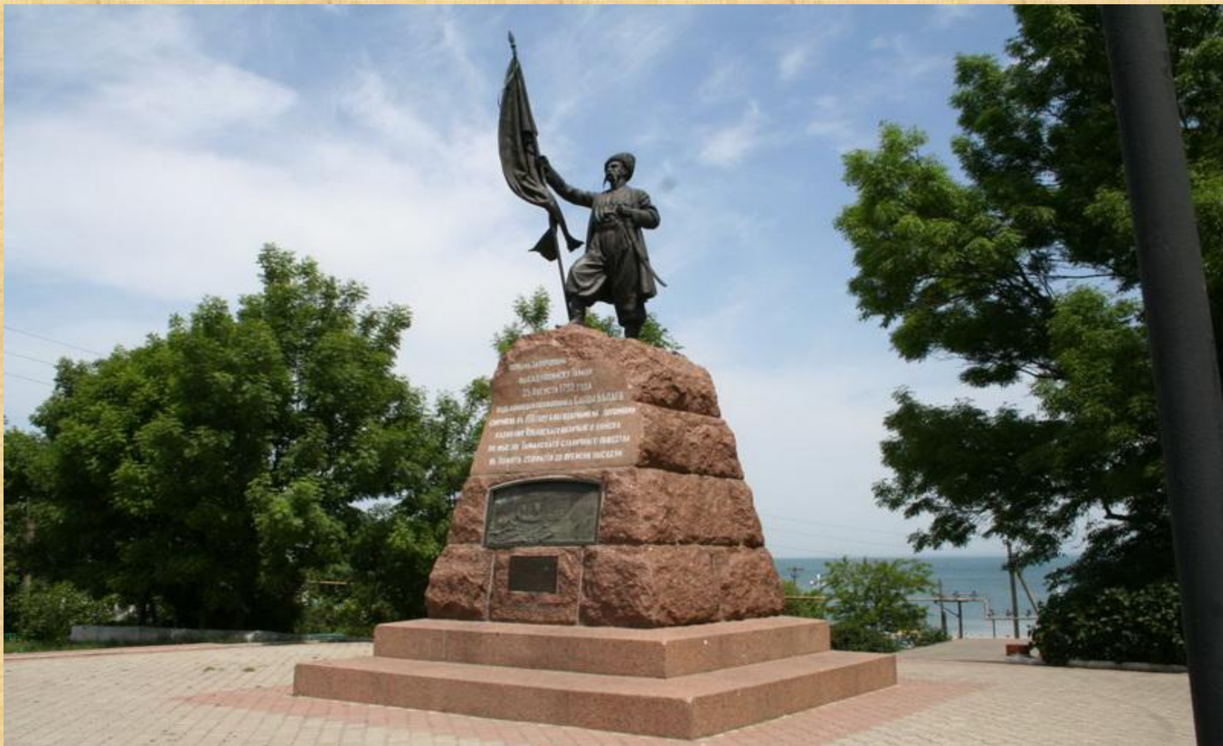
Памятник казакам-переселенцам в Тамани